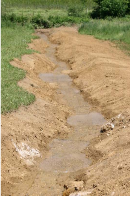
Baselbieter Naturschutztag Oktober 2008 (Bau von Kleinstrukturen)